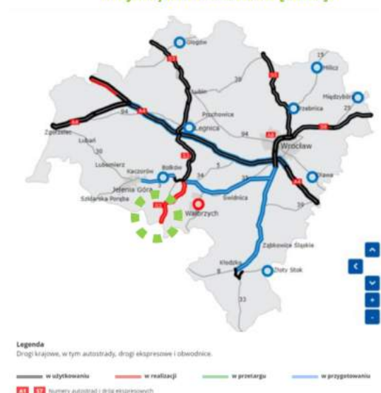
Schemat 1. Stan budowy dróg w województwie dolnośląskim – Generalna Dyrekcja Dróg Krajowych i Autostrad [2022].