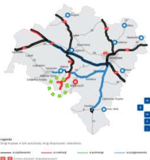
Schemat 1. Stan budowy dróg w województwie dolnośląskim – Generalna Dyrekcja Dróg Krajowych i Autostrad [2022].