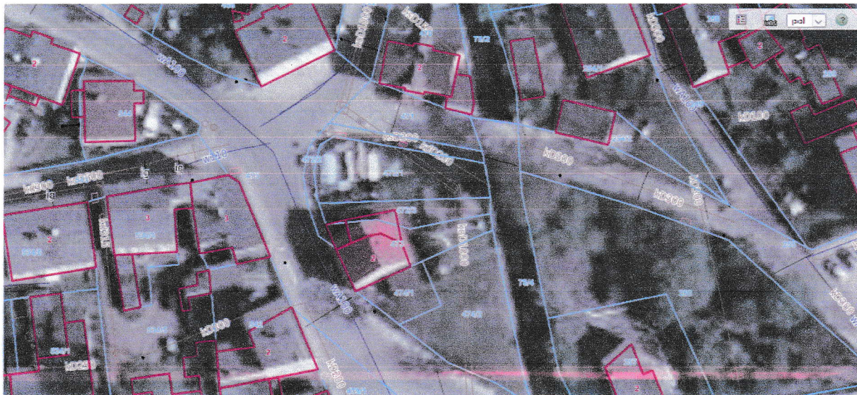
Uzbrojenie terenu w miejscu wychodzącej rury

Ten sam stan powtarza się jest już od wielu lat notorycznie w tym miejscu i pomimo ciągłych interwencji nikt z tym nic nie może zrobić, pomimo skanalizowania Lubawki w tym rejonie i przebiegającego kanału sanitarnego o średnicy 1000 mm widocznego na mapie poniżej: