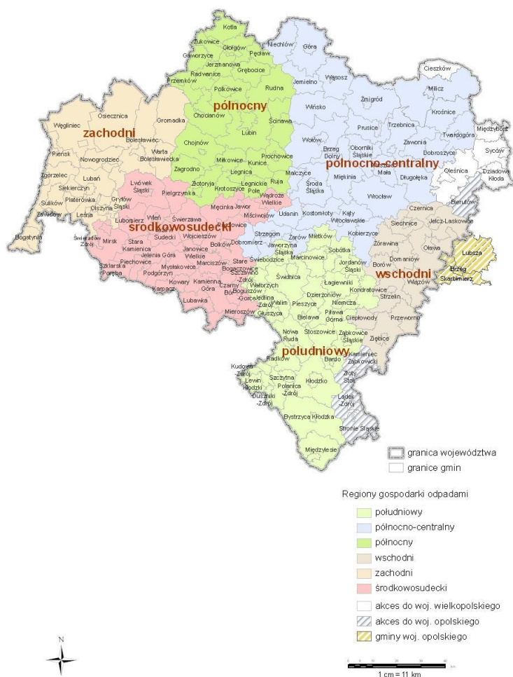
Rysunek 1. Podział województwa dolnośląskiego na regiony gospodarki odpadami

Odpady opakowaniowe- opakowania z tworzyw sztucznych, opakowania z metalu, opakowania ze szkła, opakowania z papieru i tektura przekazywane są do zakładów recyklingowych, celem poddania im dalszym procesom odzysku.