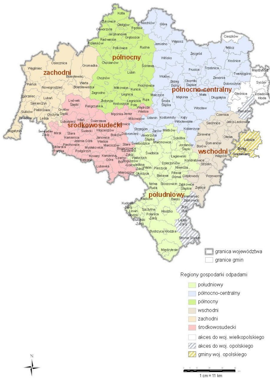
Rysunek 1. Podział województwa dolnośląskiego na regiony gospodarki odpadami (źródło: WPGO)