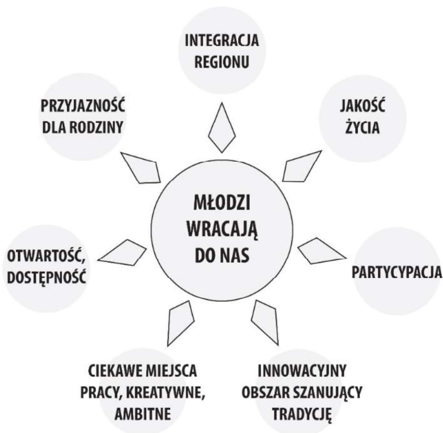
Rysunek 19. Determinanty powrotu i przyciągania ludzi młodych