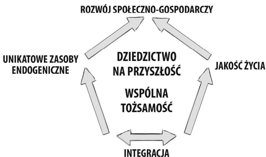
Rysunek 18. Pentagon Sudety 2030

Wzmacnianie i właściwe wykorzystanie tych parametrów przełoży się na utrzymanie oraz dalszą rozbudowę bogatego dziedzictwa materialnego i niematerialnego tego obszaru oraz pozwoli na stworzenie i umacnianie wspólnej tożsamości, której obecnie brakuje.