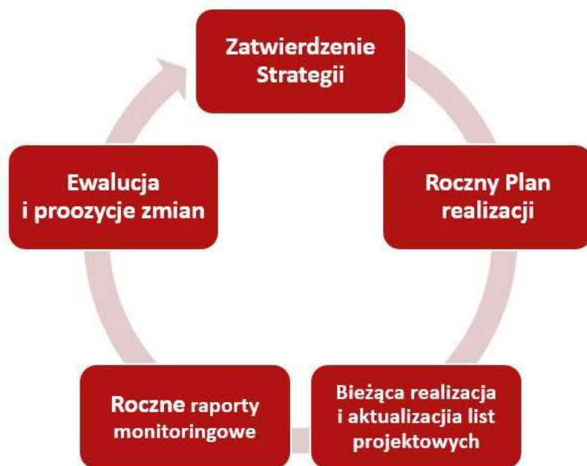
Rysunek 19. Schemat wdrażania Strategii