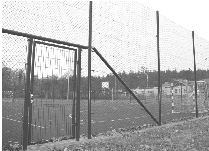
Przykładowy widok ogrodzenia boiska

płaszczyzną konstrukcji oraz zaleceniami producenta. Dla ogrodzenia należy wykonać minimum 40 słupów. Usztywnienie narożne zgodne z technologią producenta ogrodzenia. Kolor ogrodzenia – zielony lakierowany proszkowo. Wszelkie materiały zastosowane do wykonania materiałów i słupków ogrodzenia muszą posiadać ważne atesty higieniczne.