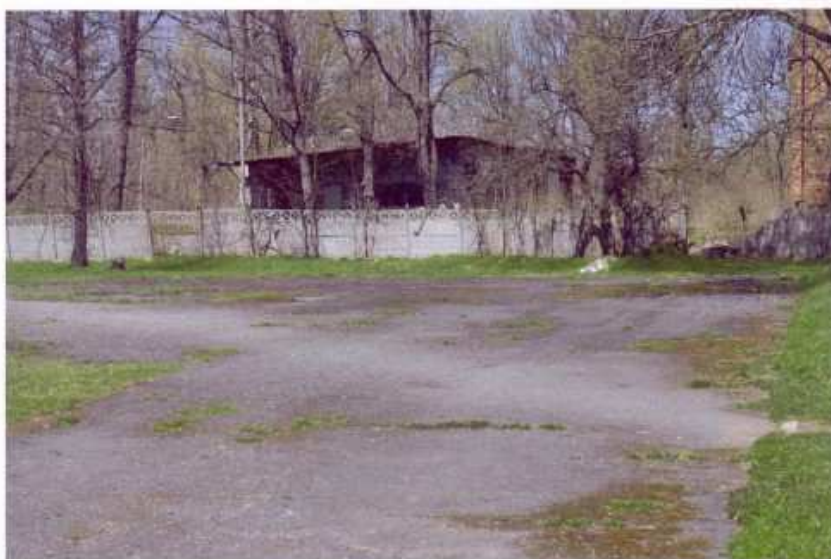
Fot.1 Widok ogólny na istniejący plac podlegający rewitalizacji