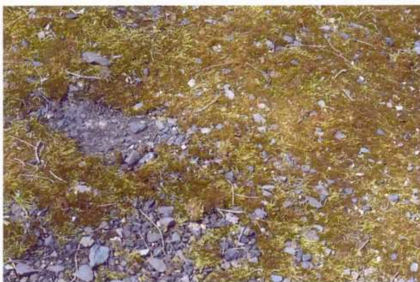
Fot.2. W przeważającej części wierzchnia część placu przed ułożeniem nowej nawierzchni bitumicznej wymaga oczyszczenia z mchu i roślinności.