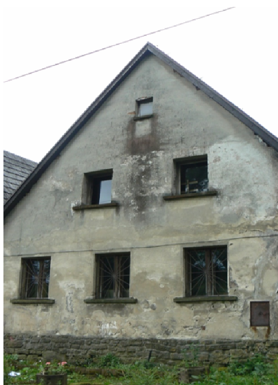
Fot. 11. Ubytki w tynku ściany szczytowej na styku w połacią dachową, zniszczona kolorystyka elewacji.