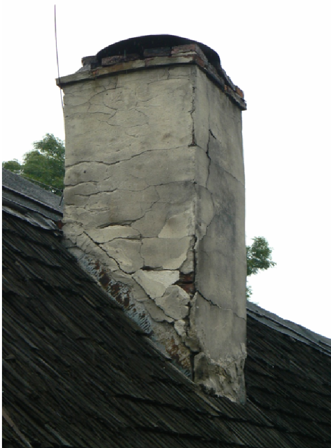
Fot. 6. Zniszczona połać dachowa, uszkodzony komin, brak obróbek blacharskich – bud. 17.