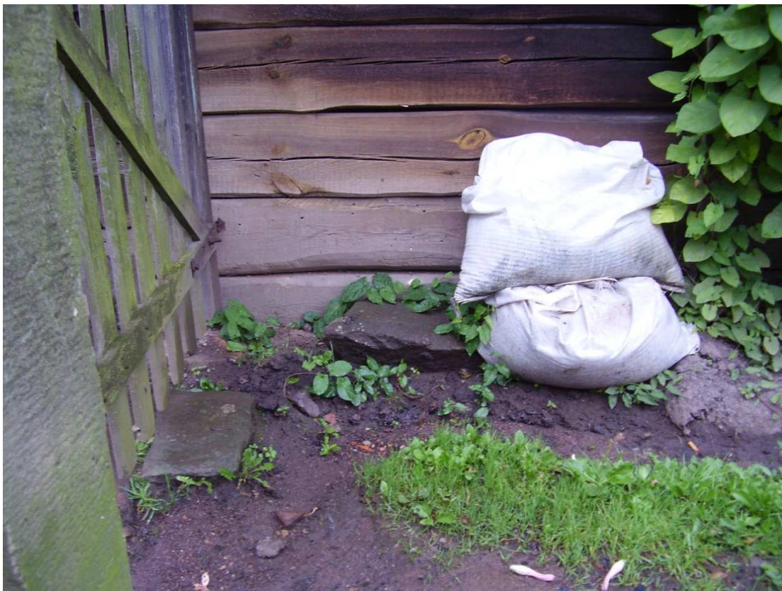
Fot. 14. Brak murowanego cokołu i odwodnienia liniowego (zalewanie ściany zewn.) – bud. 23