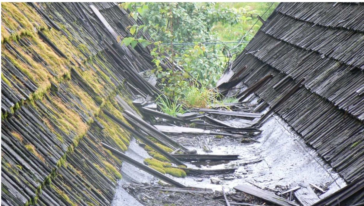
Fot. 8. Zdegradowane pokrycie dachów oraz rynna koszowa między budynkami 18 i 19.