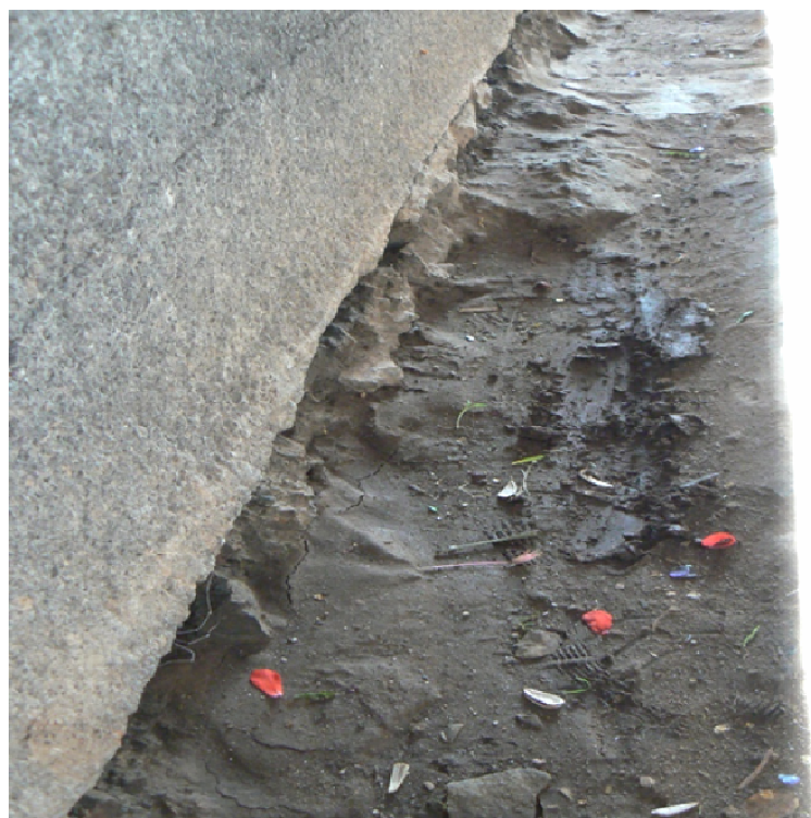
Fot. 3. Brak odwodnienia podcienia