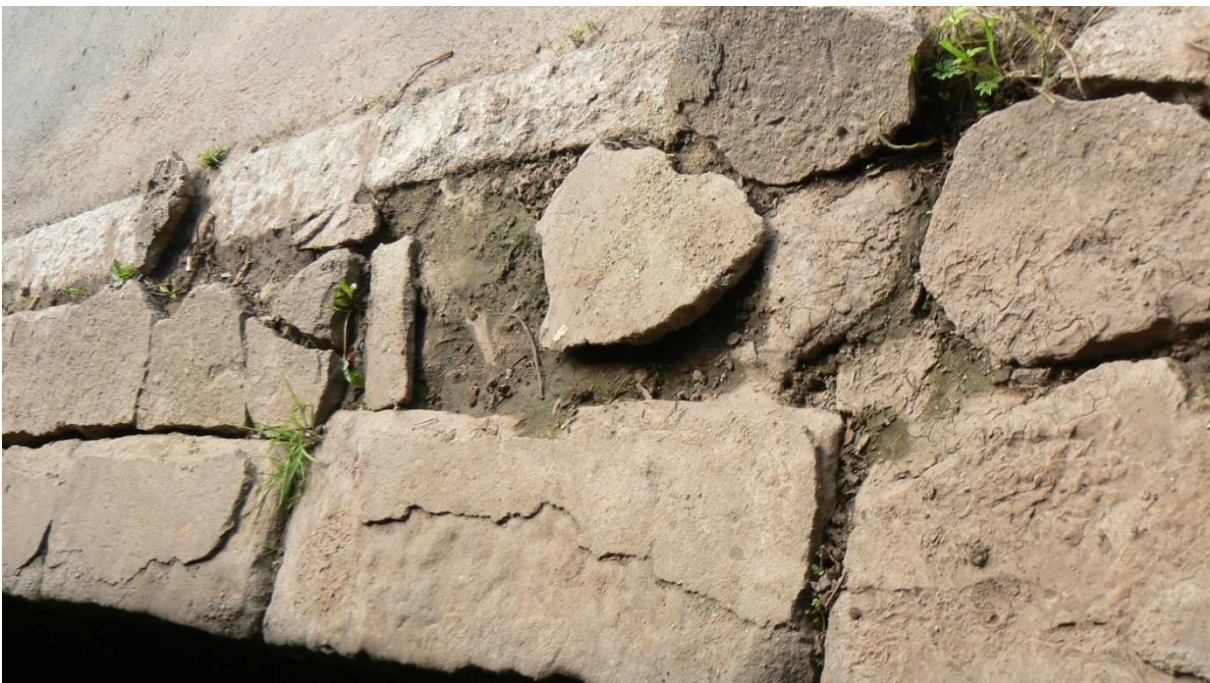
Fot. 1. Zdegradowany murek oporowy pomiędzy jezdnią a podcieniem

Na fotografiach przedstawiono wybrane przykłady przedstawiające uszkodzenia poszczególnych elementów konstrukcji