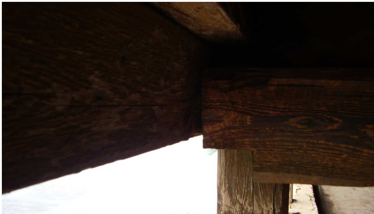
Fot. 2. Brak słupa podpierającego podcień oraz obniżenie belki przy bud. 20