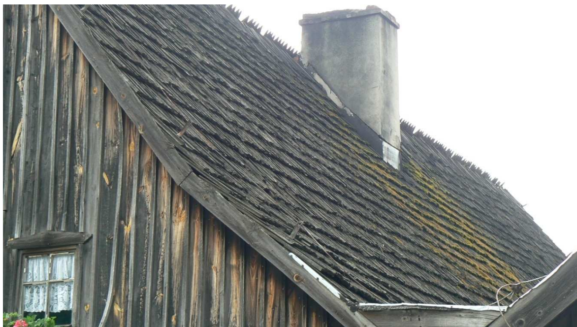
Fot. 7. Wypaczone listwy maskujące, brak obróbek, zdegradowane poszycie dachowe, ubytki w koronie komina.