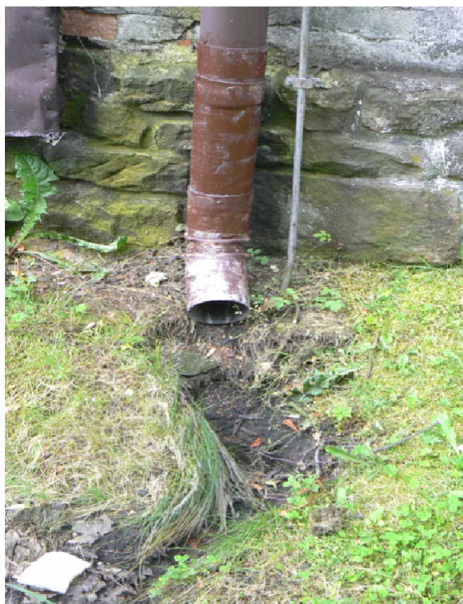
Fot. 13. Brak odprowadzenia wód opadowych od budynku – bud. 14.