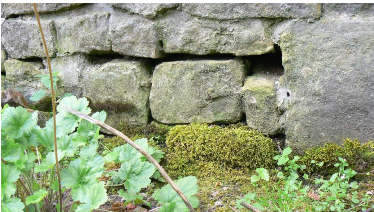
Fot. 9. Ubytki w spoinach podmurówki od strony ogrodu – bud. 14.