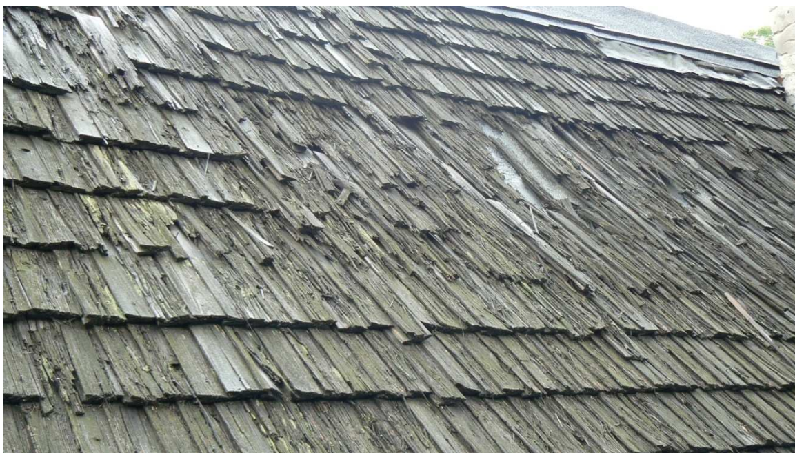
Fot. 5. Zniszczona połać dachowa – bud. 17.