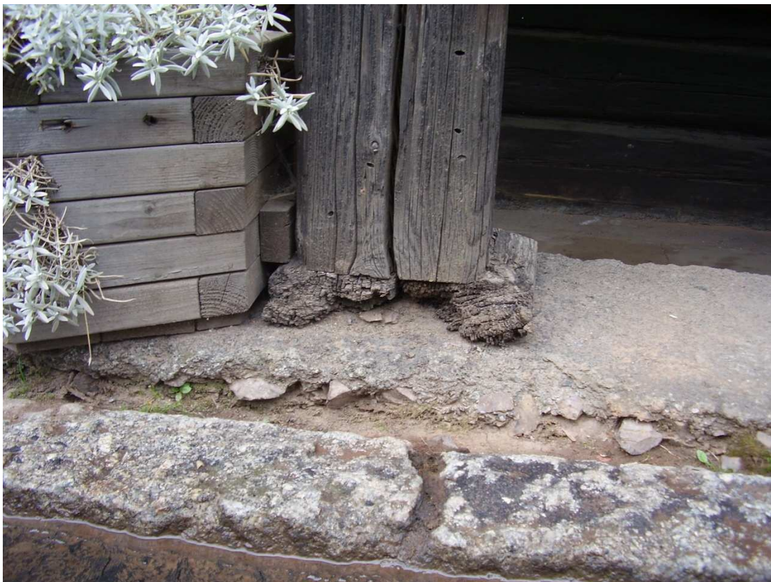
Fot. 4. Zdegradowane drewniane podstawy większości słupów.