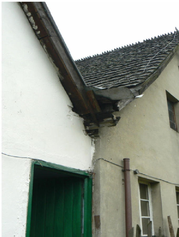
Fot. 12. Uszkodzenie kosza i rury spustowej – bud. 20-21.