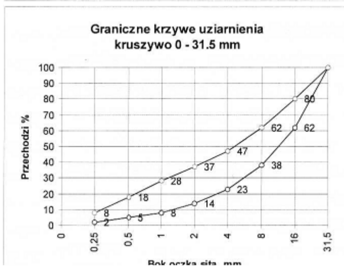
Graniczne uziarnienie kruszywa