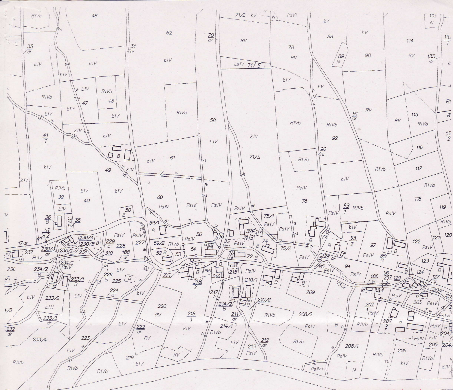
Karta mapy 2

Uzgodniono pod względem wymagań higienicznych i zdrowotnych bez zastrzeżeń/ z zastrzeżeniami na podstawie ustawy z dnia 14 marca 1985r. o Państwowej Inspekcji Sanitarnej (Dz.U. z 2006r. Nr 122, poz. 851 z późn. zm.)