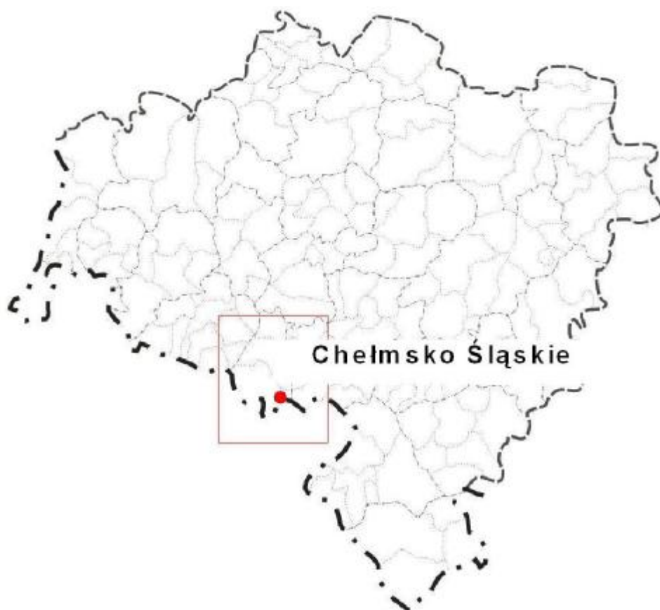
Rysunek 1. Lokalizacja miejscowości Chełmsko Śląskie na tle województwa dolnośląskiego.

Chełmsko Śląskie jest wsią położoną w południowo-zachodniej części województwa dolnośląskiego tuż przy granicy z Republiką Czeską. Administracyjnie przynależy do gminy Lubawka, która jest częścią powiatu kamiennogórskiego. W latach 1975-1998 miejscowość administracyjnie stanowiła część województwa jeleniogórskiego. Wieś graniczy bezpośrednio z miejscowością Błazejów, od Lubawki oddalona jest o 6 km i 15 km od miasta powiatowego Kamienna Góra. Do roku 1945 Chełmsko Śląskie posiadało prawa miejskie, jego powierzchnia wynosi ok. 1082 ha.